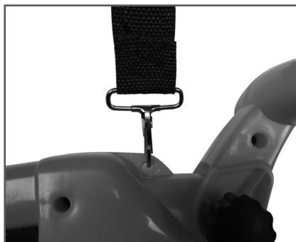
Рис. 2 Установка подвесного ремня

Установите ремень на устройстве. Для этого вставьте кронштейн ремня в отверстие на корпусе устройства (Рис. 2).